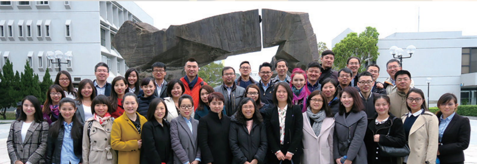
15 级北京班同学们在香港中文大学百万大道烽火台合影