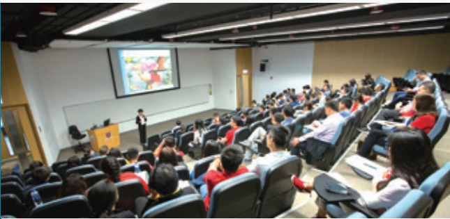
案例分析的形式分享使得同学们更为投入明白