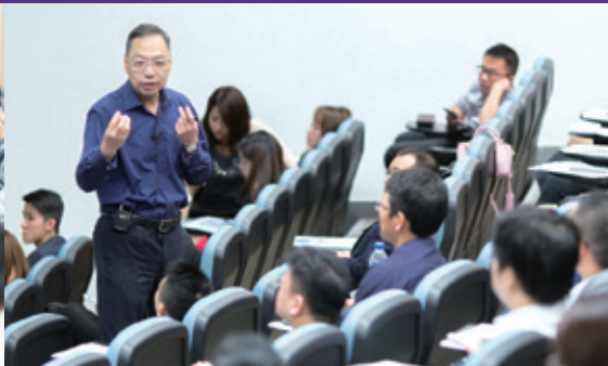
讲者与同学们互动提问