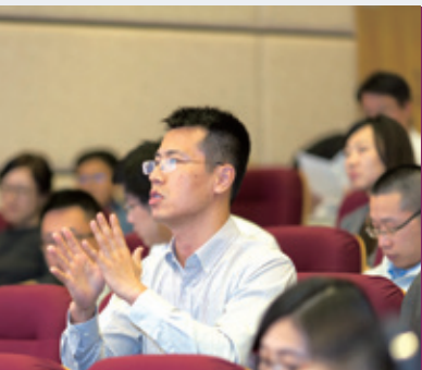
精彩的演讲让同学们获益良多