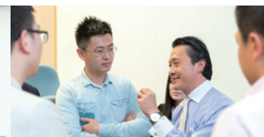
同学们参与度非常高