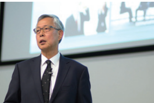
香港特别行政区前警务处处长李明逵先生