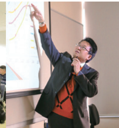
香港中文大学庄太量教授